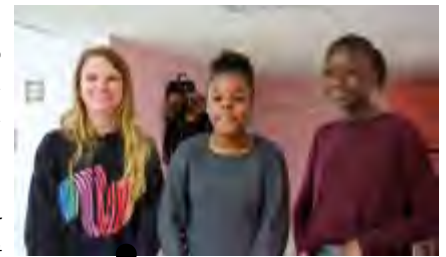
Perrine, Tiguidé et Korka, trois jeunes participantes

Ciné-crêpe du mardi 18 février dernier avec la diffusion du film «Le grand bain» de Gilles Lelouche