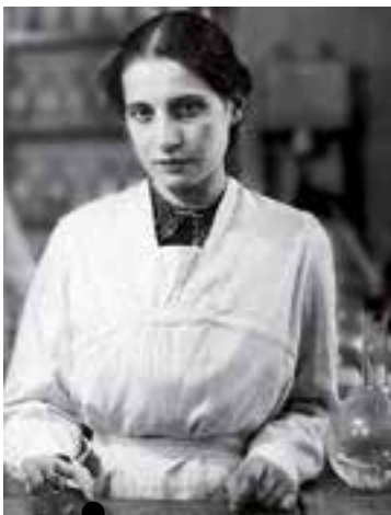
Lise Meitner, physicienne

Certaines femmes scientifiques ont bravé les difficultés liées à la condition féminine. D'autres ont été confrontées aux barrières qui s'opposaient à elles. Des membres de l'ALCA présenteront cinq femmes dont le destin sert d'illustration pour toutes ces autres vies de femmes brillantes mais oubliées par l'Histoire. Vous voulez en savoir plus ? Rendez vous jeudi 14 février à la Bouvêche dès 20h30 (entrée libre).