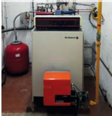
Chaufferie de la maison des associations Avant