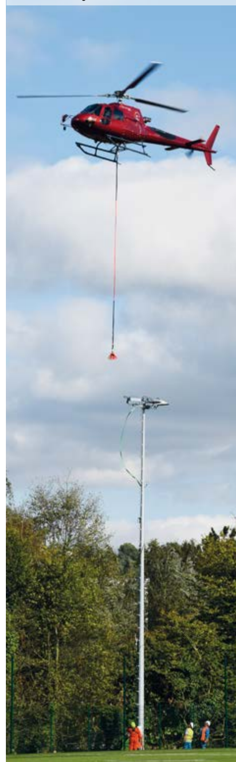
Pose de l'éclairage

En termes sportifs, qu'est-ce que cela va changer ? Les terrains synthétiques de rugby se rapprochent de plus en plus de la pelouse en termes de qualité. C'est plus sécuritaire, car il y a une meilleure accroche, moins de trous. Bref, nous sommes tous ravis et impatients de le tester !