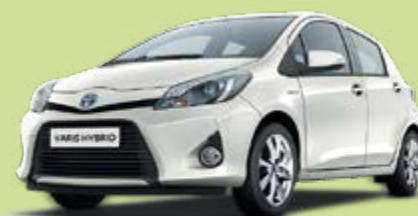
- VÉHICULES FABRIQUÉS À VALENCIENNES -

Six nouvelles voitures hybrides, fabriquées en France, viennent de rejoindre la flotte automobile de la mairie. Stationnées sur le parking de l’Hôtel de Ville, elles seront utilisées par les agents municipaux pour leurs trajets professionnels, grâce à un système d’autopartage. Le but ? D’une part, se défaire progressivement des véhicules les plus polluants pour se tourner vers des énergies propres et d’autre part, mutualiser davantage et optimiser l’utilisation de cette flotte automobile. Le nombre de véhicules municipaux est ainsi réduit et passe de 41 à 36 alors que les véhicules diesel, majoritaires en 2016, ne représentent plus que 30% de la flotte.