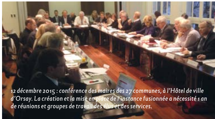
12 décembre 2015 : conférence des maires des 27 communes, à l'Hôtel de ville d'Orsay. La création et la mise en place de l'instance fusionnée a nécessité 1 an de réunions et groupes de travail des élus et des services.

On ne dira plus la CAPS. La CAPS n'est plus. Remplacée dans le cadre de la réforme territoriale par une nouvelle communauté d'agglomération, née de la fusion de la CAPS et d'Europe'Essonne (auxquelles se rajoutent les villes de Verrières-le-Buisson et Wissous). Orsay intègre désormais un territoire intercommunal d'environ 300 000 habitants.