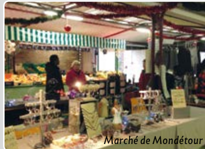
Marché de Mondétour

SAMEDI 12, VENDREDI 18 ET DIMANCHE 20 DÉCEMBRE