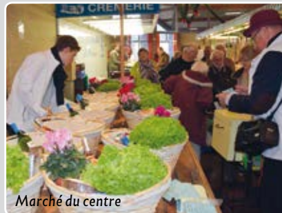
Marché du centre