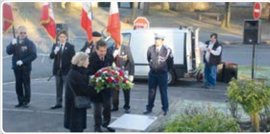
Cérémonie en mémoire des 24 000 militaires français morts pour la France pendant la guerre d'Algérie.