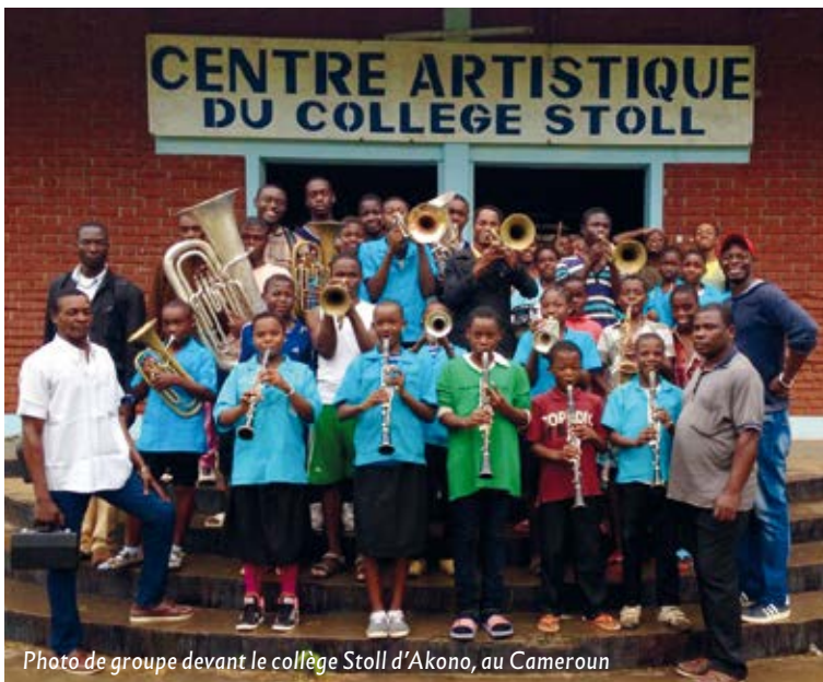
Photo de groupe devant le collège Stoll d'Akono, au Cameroun