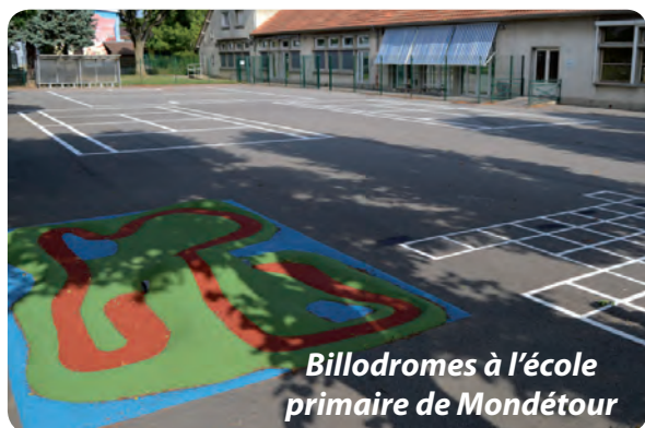
Billodromes à l'école primaire de Mondétour

Travaux dans les établissements et les gymnases du Guichet et de Mondétour, nouvelle cour de l'école élémentaire du Centre. La ville s'est engagée dans d'importants travaux de rénovation des équipements destinés aux enfants d'Orsay. Tour d'horizon des principales actions réalisées et à venir.