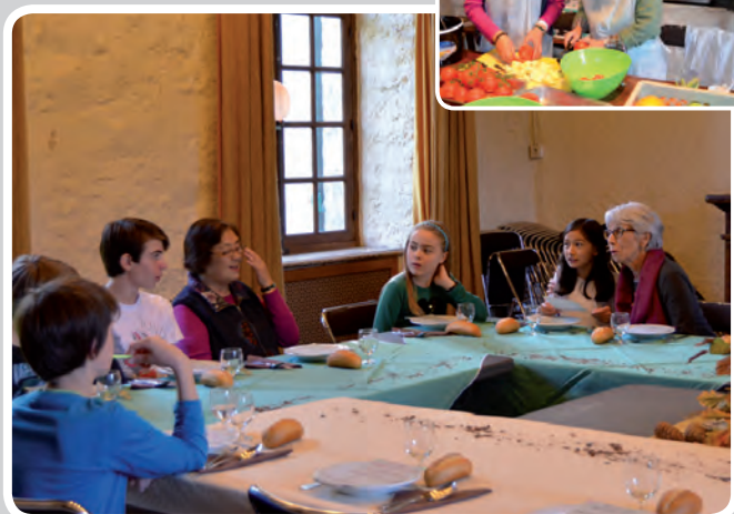
Ateliers cuisine : à la Bouvêche mercredi 23 octobre, ce sont les enfants de l'atelier du Cesfo qui ont dressé la table et créé les cartes des menus, pendant que les personnes âgées des RPA ont aidé à concocter les plats !