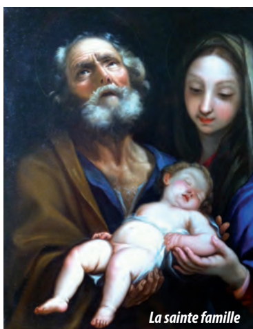
Les toiles restaurées en 2012 par les ateliers Joyerot et Liancourt