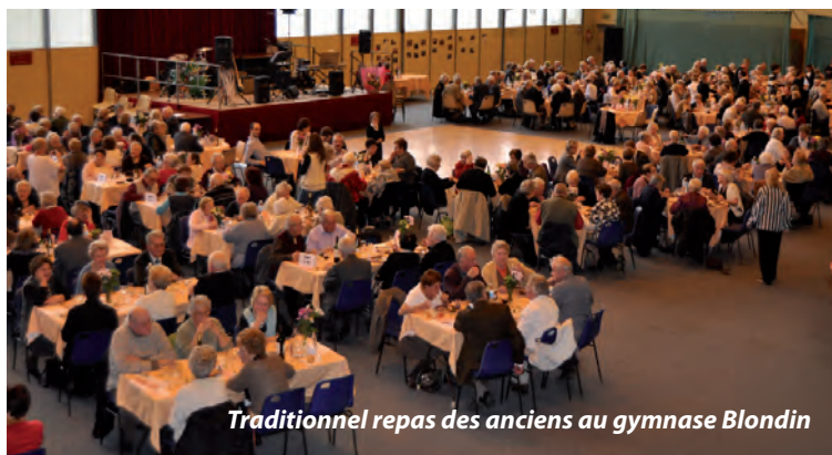
Traditionnel repas des anciens au gymnase Blondin

CONTACT CCAS : MISSIONINTERG@MAIRIE-ORSAY.FR