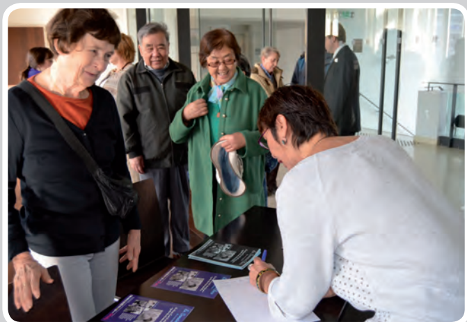
Les seniors étaient au rendez-vous pour l'ouverture, le 21 octobre ! Une semaine riche en ateliers, projections, jeux et formations.