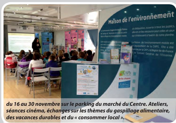
du 16 au 30 novembre sur le parking du marché du Centre. Ateliers, séances cinéma, échanges sur les thèmes du gaspillage alimentaire, des vacances durables et du « consommer local ».