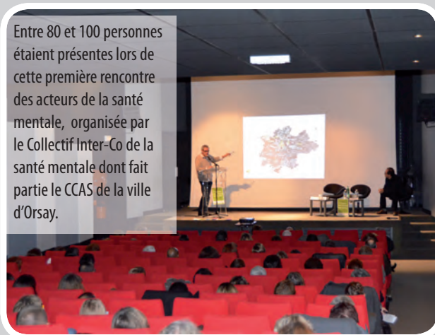
Entre 80 et 100 personnes étaient présentes lors de cette première rencontre des acteurs de la santé mentale, organisée par le Collectif Inter-Co de la santé mentale dont fait partie le CCAS de la ville d'Orsay.