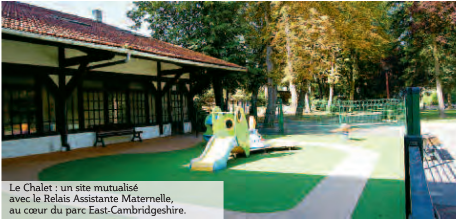
Le Chalet : un site mutualisé avec le Relais Assistante Maternelle, au cœur du parc East-Cambridgeshire.

Aide à la parentalité, pourquoi ? On pourrait s'étonner de ce que l'état de parentalité, éminemment privé et intime, nécessite une aide des pouvoirs publics. Pourtant, nombreux sont les parents, qui parfois, au cours de la relation avec leurs enfants, attendent un soutien, une écoute, un lien. Et en accueillant ces parents, en toute confidentialité et dans une optique de travail de partage et d'entraide, c'est la prévention des troubles de la relation parents/enfants que l'on dynamise. C'est se donner les moyens concrets de faire de la petite enfance une vraie priorité, au-delà des modes de garde ou des aides financières.