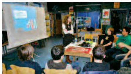
Informier, prévenir, écouter et échanger avec les jeunes collégiens et lycéens. C'est la base de la prévention portée par le Service jeunesse.

lycées), cette instance est un partenariat entre les forces vives municipales, celles du milieu scolaire public et le milieu associatif. Objectif : mettre sur pied des actions de prévention communes autour de la santé et de la citoyenneté, en direction des jeunes scolarisés à Orsay.