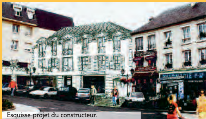
Esquisse-projet du constructeur.