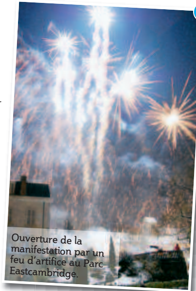
Ouverture de la manifestation par un feu d'artifice au Parc Eastcambridge.

Ateliers pour les enfants, carrousel de chevaux de bois et distribution de cabas... Tous nous garderons en mémoire - les enfants en particulier - le beau village de Noël proposé en décembre par l'association des commerçants d'Orsay avec le soutien de la mairie et de la Chambre de commerce et d'industrie. Le tout en présence d'un invité de choix : le Père Noël en personne !