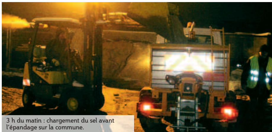
3 h du matin : chargement du sel avant l'épandage sur la commune.