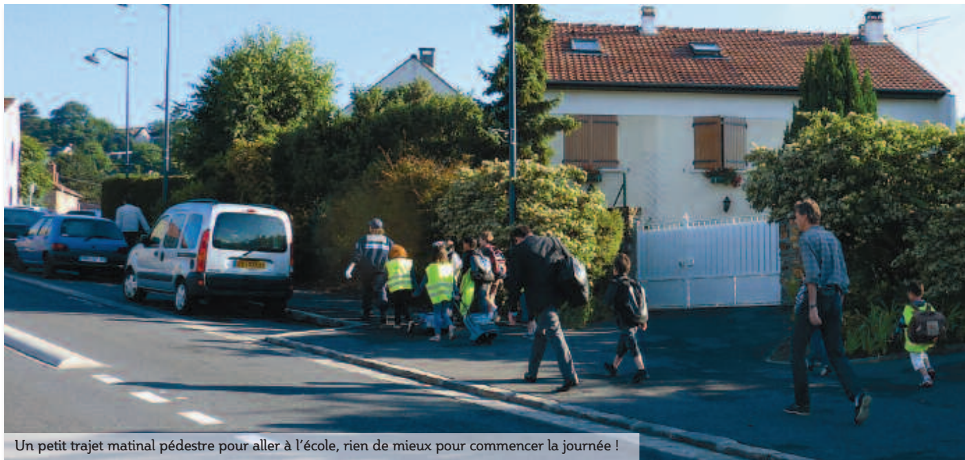
Un petit trajet matinal pédestre pour aller à l'école, rien de mieux pour commencer la journée !

La rentrée, c'est le moment d'organiser les déplacements quotidiens de toute la famille, en tenant compte du Pédibus, bien sûr ! Le Pédibus est un ramassage scolaire à pied, organisé et géré dans un esprit d'échange de services entre les parents (les conducteurs), avec