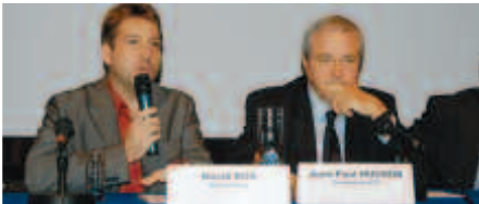
David Ros, maire d'Orsay et Jean-Paul Huchon, président de la Région Île-de-France.

Plus de 200 usagers venus d'Orsay et des villes voisines ont participé aux débats sur le RER B avec des représentants de la RATP, de la SNCF et du syndicat des transports d'Île-de-France.