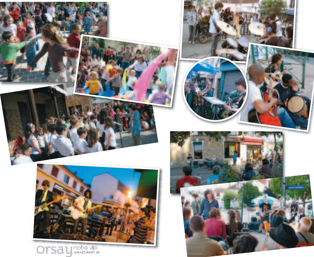
"Woodstock 2009" Parc Eastcambridgeshire.