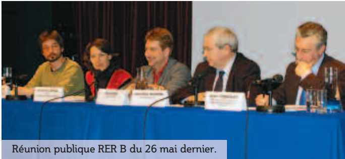
Réunion publique RER B du 26 mai dernier.