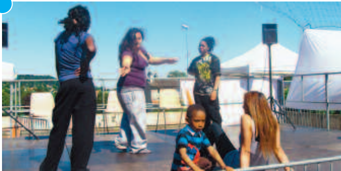
Cérémonie du 18 juin