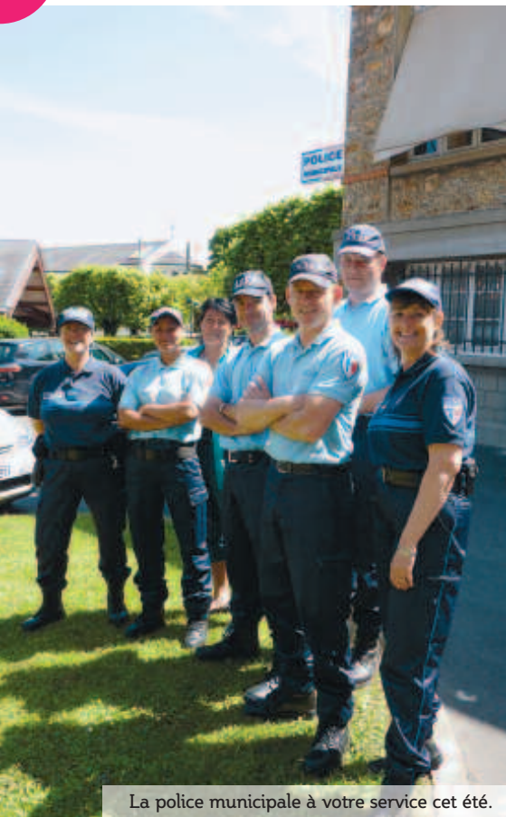
La police municipale à votre service cet été.