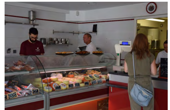
Churrasqueira de Mondétour