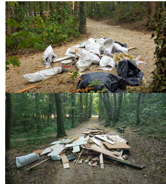
Dépôts sauvages signalés sur la plate-forme