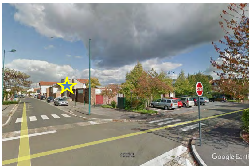
Emplacement VAE Prévu : Boulevard de Mondétour