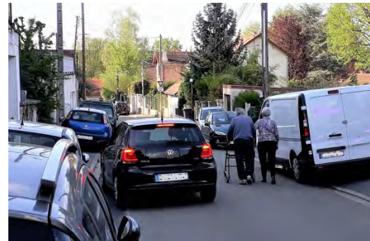
Encombrement et difficultés de la circulation avenue des Platanes