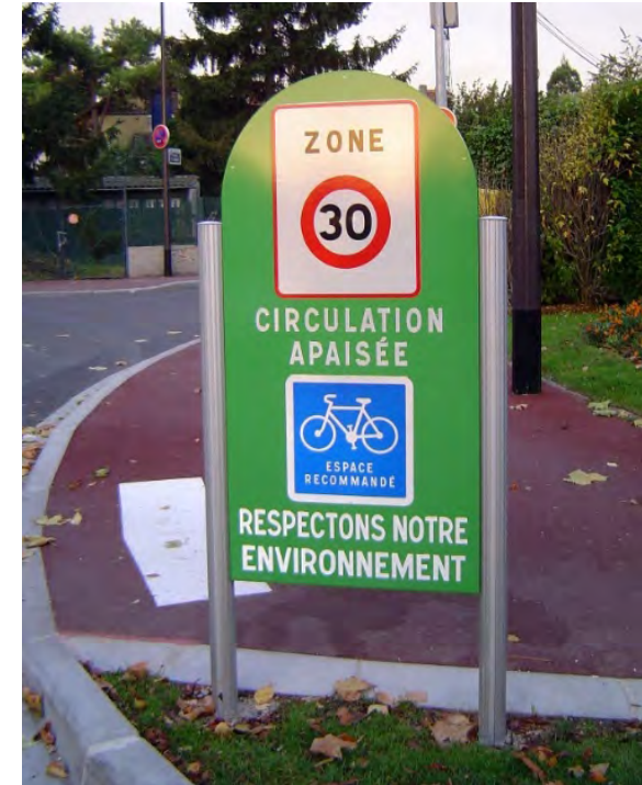
Type de panneau envisagé