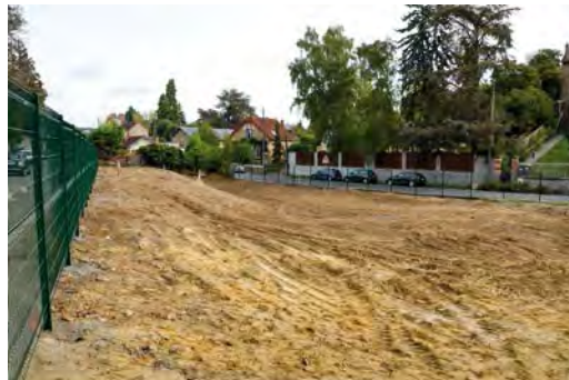
Station Shell après démolition