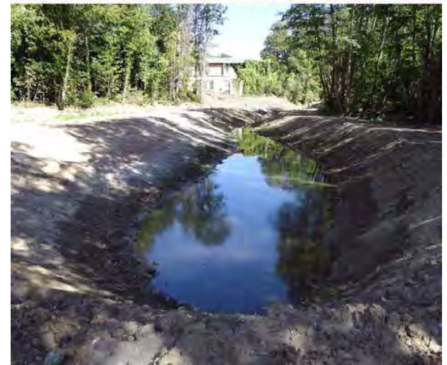
PHASE 4 : Création de Frayères