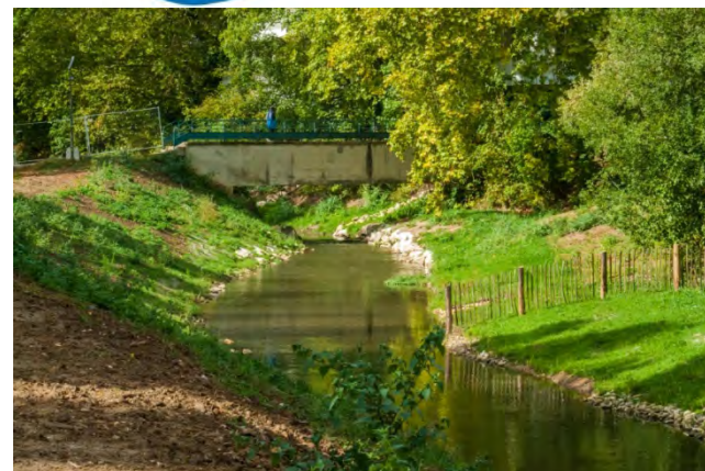
L'Yvette après suppression du clapet (vue depuis la rue Elisa Desjobert)