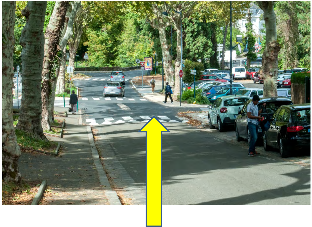
Déplacement de l'arrêt de bus (Création d'un pôle bus ) pour une rue Elisa Desjobert plus fluide