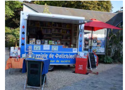
Carriole de Polichinelle