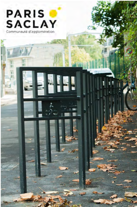
Arceaux à vélos (sortie de la gare Orsay-Ville)