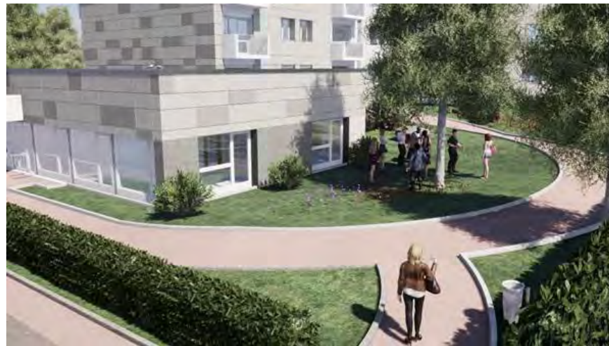
Visuel projeté du 20 avenue St-Laurent

Montant de l'investissement: 3 812 500 € TFC Planning prévisionnel : 17 mois de travaux à compter de juillet 2019