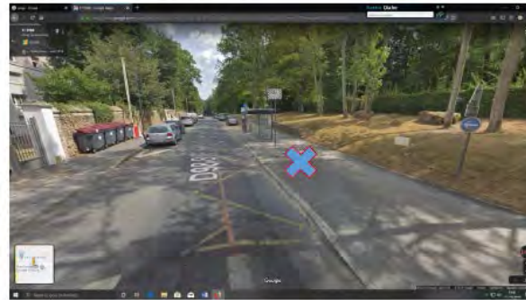
5. Gare d'Orsay-ville