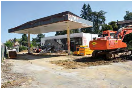
Station Shell avant démolition