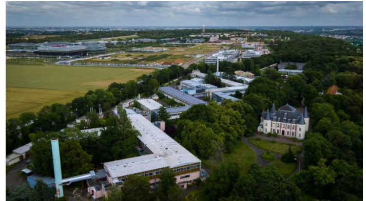
Vue aérienne, ZAC de Corbeville avec le Château de Corbeville.

Courrier envoyé prochainement à la présidente de l'EPAPS